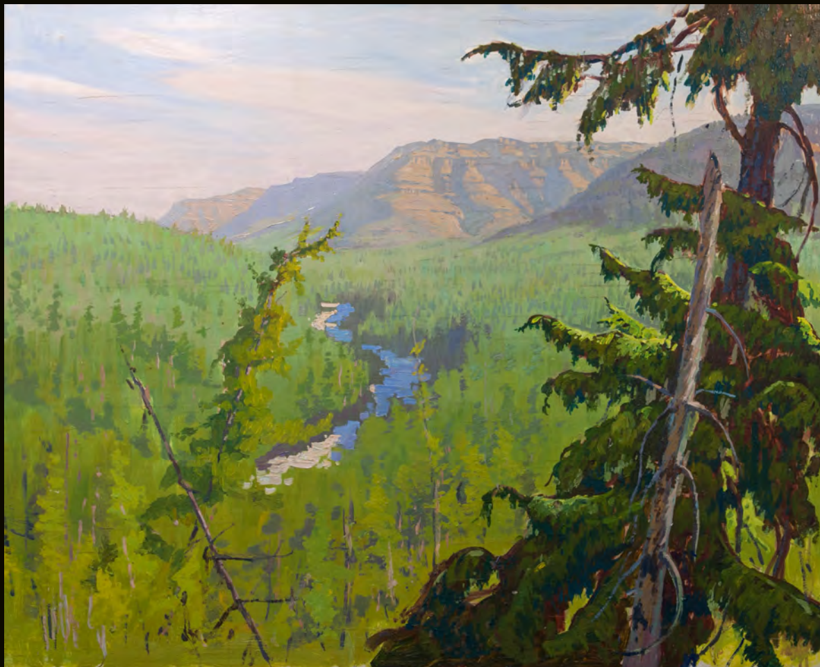
Долина реки Хойси | 2016