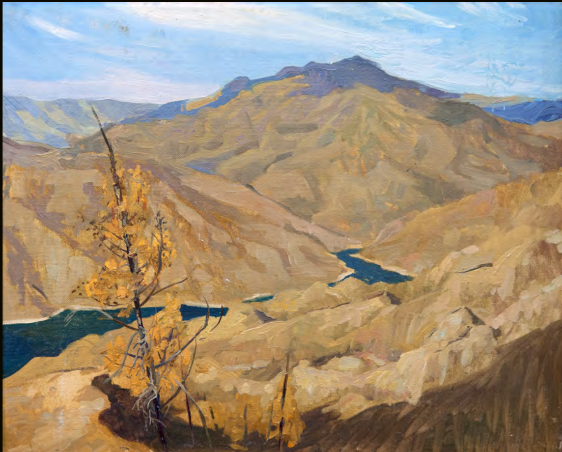
Шугур. Саяно-Шушенский заповедник | 2015