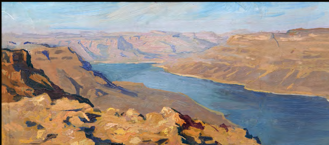
Природа затихла | 2016